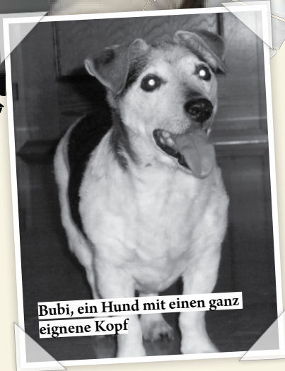
Bubi, ein Hund mit einem ganz eigenen Kopf